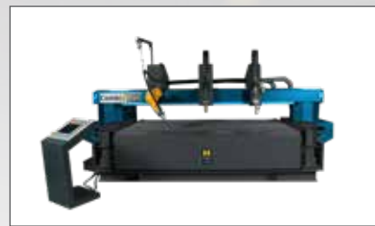
Machines de découpe plasma

HACO SAS ZI rue Laënnec 59930 La Chapelle d'Armentières FRANCE T +33 (0) 3 20 10 30 40 E-Mail: commercial@haco.fr www.haco.fr