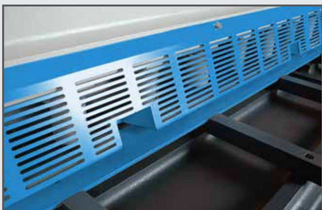
Grille spéciale avec encoches pour couper des bandes fines.