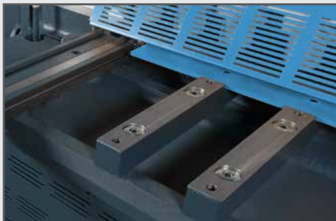
Billes de manutentions dans les consoles pour faciliter la manipulation des tôles.