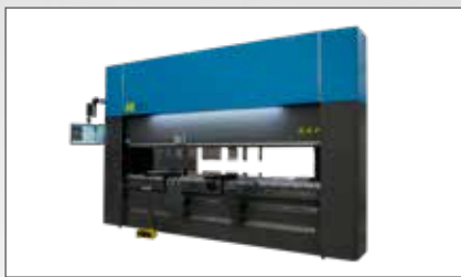
Presses Pliuses CNC