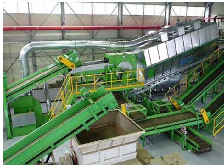
Nihot maakt machines zoals de Windshifter en de Drum Separator die van lucht gebruikmaken om afval te scheiden